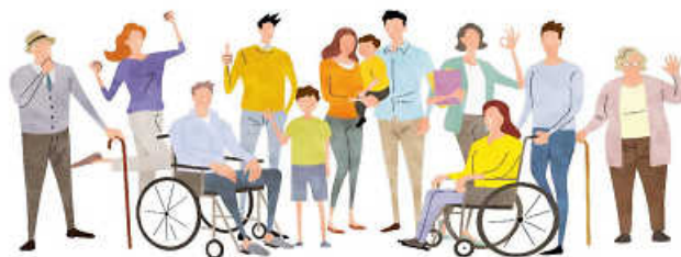
Soziale Angebotskarte des Landkreises Calw.

Pflege- oder Hilfebedürftigkeit tritt häufig ohne Vorwarnung ein. Betroffene und Angehörige können sich schnell überfordert fühlen. Da kommt es auf das richtige Hilfesystem an - Welche Möglichkeiten und Angebote gibt es und wo finde ich eine passende Unterstützung?