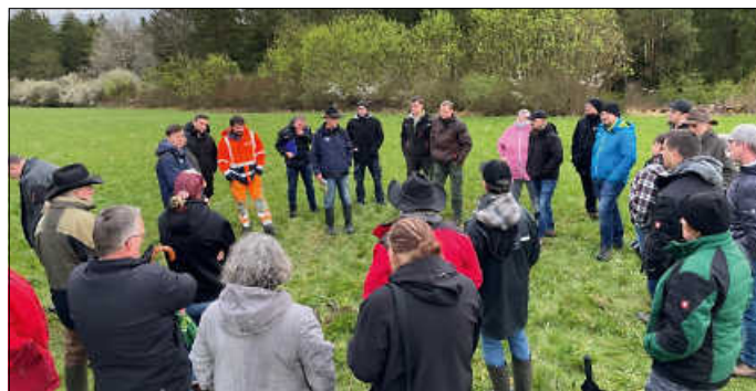
Die Teilnehmer beim gemeinsamen Austausch in Gültlingen.

Findet man lediglich vereinzelt Giftpflanzen auf den Wiesen, sollte man diese sofort ausgraben und abfahren. Ist der Grünlandbestand bereits stark mit den Herbstzeitlosen bewachsen, empfiehlt sich, sobald sich der Samenstand der Pflanzen aus dem Boden geschoben hat (Anfang bis Mitte April), die Fläche zu mulchen und dann etwa drei Wochen später nochmals. Mit dieser sich über Jahre wiederholenden Maßnahme werden die Reservestoffe der Zwiebelpflanze erschöpft. Damit können mittelfristig gute Erfolge erzielt werden. Im weiteren Gespräch wurde auch über weitere Pflanzen wie z. B. Jakobskreuzkraut und breitblättriger Ampfer diskutiert.