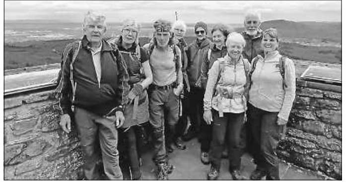
Wanderguppe auf dem Merkurturn.

erbaut um 1100 von den Grafen von Eberstein. Der erste Aufstieg wurde mit einem grandiosen Rundumblick belohnt.