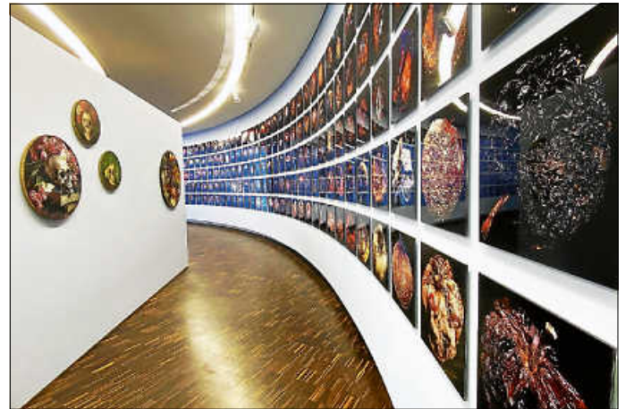
Eindrücke der Ausstellung, insbesondere der Werke „Metamorphosis“ im Museum LA 8 in Baden-Baden.

Zudem werden die einzigartigen Apfelportraits auch auf der Art Biennale Venedig im Palazzo Mora vom 09. Mai bis zum 22. November 2026 ausgestellt.