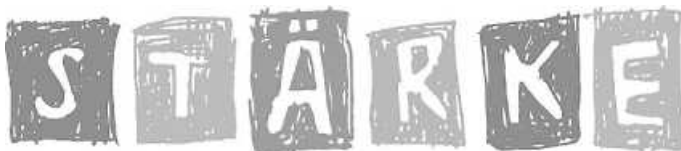
Logo Landesprogramm STÄRKE.