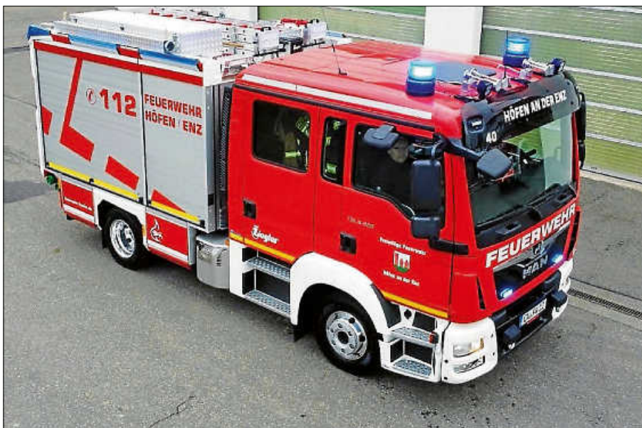
Aufnahme mit einer Drohne.