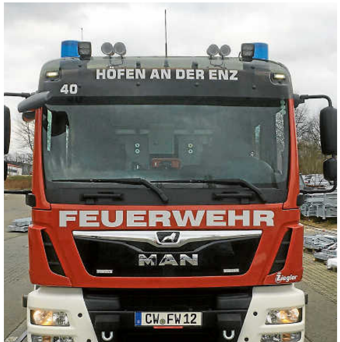
Das MLF hat die Funkkennung "Florian Höfen 40".