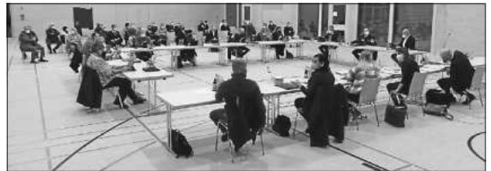
Unser Bild zeigt einen Blick in die Enzauhalle zu Beginn der Gemeinderatssitzung.

Von Zuhörern so gut besucht wie schon lange nicht mehr, und das zu Corona-Pandemiezeiten, war die Höfener Gemeinderatssitzung am Montagabend als erste öffentliche Veranstaltung der Gemeinde in der neuen Enzauhalle. Sicherlich war eben diese erste Sitzung dort einer der Gründe dafür. Aber auch die Ehrung langjähriger und verdienter Feuerwehrangehöriger, die Vorstellung des neu entwickelten Corporate-Designs der Gemeinde Höfen, die künftige hausärztliche Versorgung in Höfen und die Zukunft des Freibades in der Enztalgemeinde. Text: Ziegelbauer