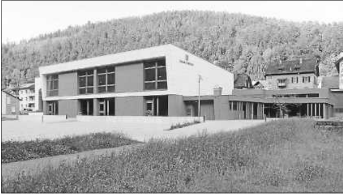
Am 28. Juli 2022 wird die neue Enzauenhalle eingeweiht.

Fertig gestellt ist sie seit Februar 2022 und wird seitdem von Vereinen, von der Schule und vom Kindergarten schon genutzt. Eingeweiht wird sie nach der jetzigen Lockerung der Corona-Schutzregelungen am 28. Juli 2022 und damit in etwa fünf Wochen: Die Enzauenhalle als das größte Bauwerk der Gemeinde Höfen in den vergangenen Jahrzehnten. Was sie gekostet hat, erfährt die Öffentlichkeit bei der Gemeinderatssitzung am Montagabend coronabedingt im Spiegelsaal des „Haus des Gastes“.