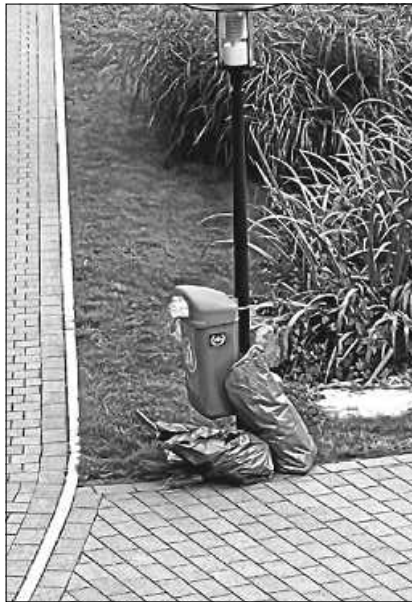
25.08.2023 - abgelegter Müll im Kurpark