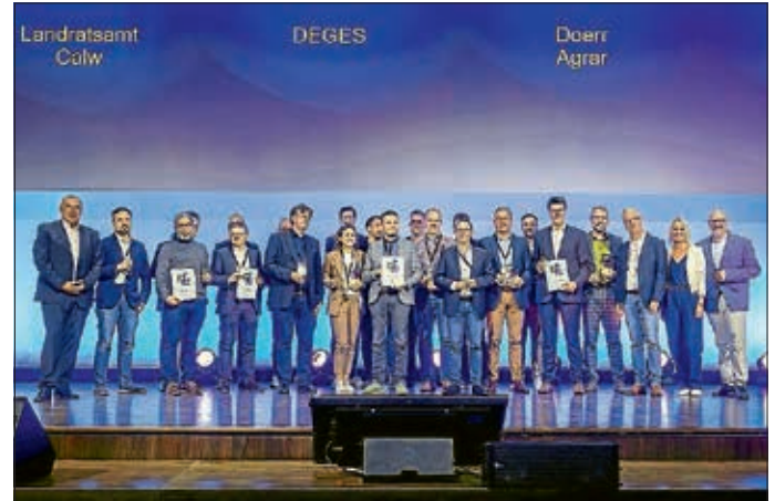
Das Landratsamt Calw erhält den GIS Innovation Award auf der Esri Konferenz 2023.

Der Landkreis erhielt diese Auszeichnung für entschlossenes Bestreben, modern und zeitgemäß aufgestellt zu sein und den Mut, als erste Institution in Deutschland mit dem neuen ArcGIS Produkt zu arbeiten.